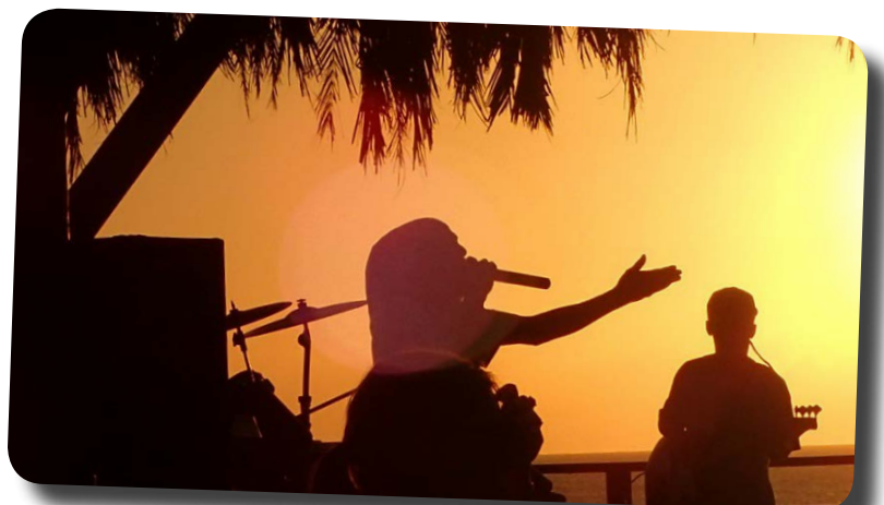
Reagge i solnedgånen på Jamaica.