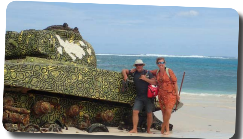
Vid en av de kvarlämnade stridsvagnarna på Flamenco Beach på Culebra.