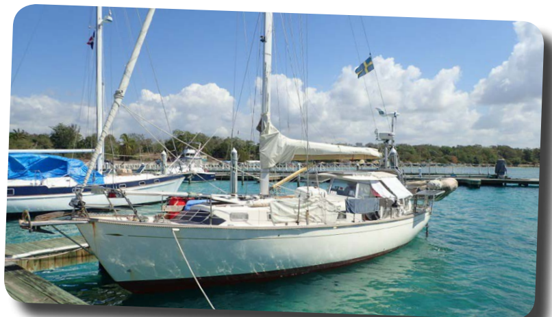
Nanny ligger i för en gångs skull i marina vid Boca Chica för att checka ut ur Dominikanska republiken.