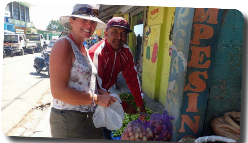
Grönsakshandling i Barahona.